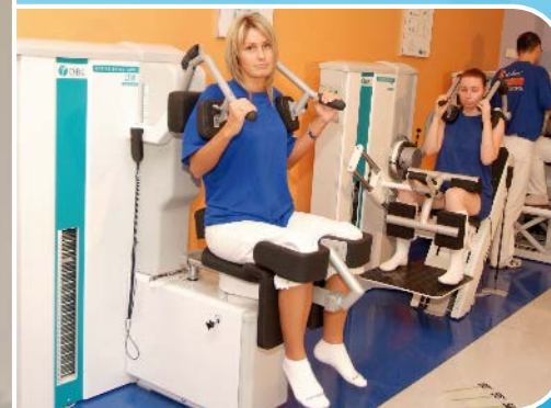
Rehabilitacja schorzeń narządów ruchu