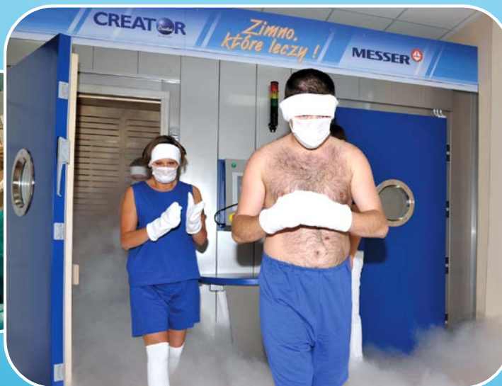
Krioterapia ogólnoustrojowa i miejscowa